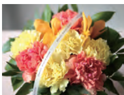
YELLOW & ORANGE