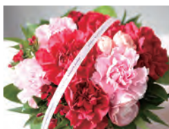
PINK & RED